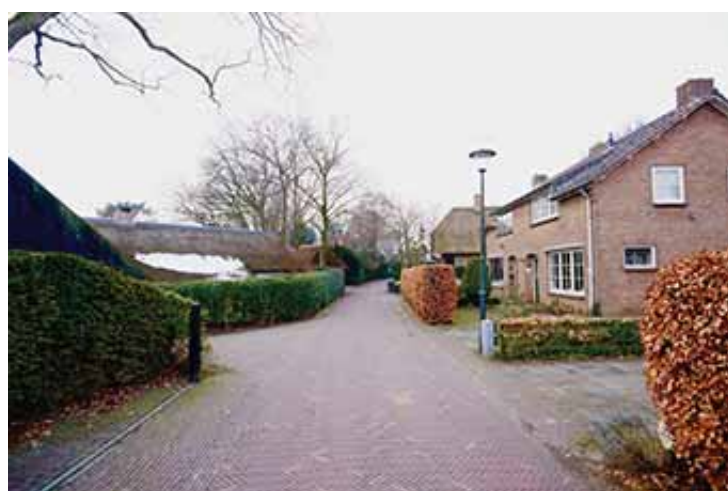
Mosselweg 28 en 30, met links het paadje naar de Meentweg