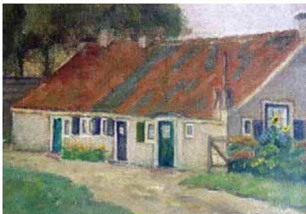
Armenhuis aan de Mosselweg

gewicht: als we na de kerstdagen maar niet teveel zijn aangekomen, anders gaan we met z'n allen aan een of ander dieet. Hoe anders was het in Blaricum pakweg 75 jaar geleden. Er was toen nog een Armenhuis. Dit huis stond aan de Singel waarin mensen woonden die geen inkomen hadden. Als gevolg daarvan moesten zij rondkomen van de toenmalige armenzorg wat absoluut geen vetpot was.