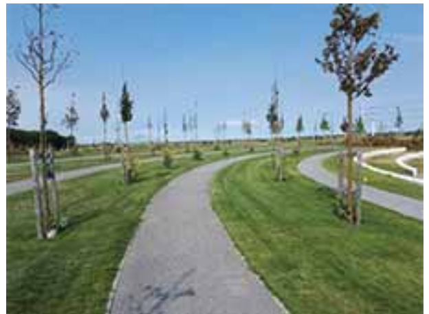
Herdenkingbos MH 17

Dit dorp is gelegen in de gemeenten Haarlemmermeer. Heeft 4.387 inwoners. Het nationaal Monument MH 17 is een herdenkingsbos /park, met gedenktekens. De Stichting wil de gevoelens van alle nabestaanden een plek geven. Het monument is een bijzonder landschapsobject dat de herinnering, aan de 298 slachtoffers levend wil houden. Er zijn idem zoveel bomen geplant in een green lint ter nagedachtenis aan de slachtoffers. Voor elke persoon een boom. Met een plaatje ervoor met de naam, land van herkomst, geboortedatum. Dit is omringd door een krans van zonnebloemen. Op 17 juli 2017 is het Nationaal Monument MH 17 door nabestaanden in gebruik genomen. Dit tijdens een jaarlijkse herdenkingsdienst. Het Koningspaar en Premier Rutte waren ook daarbij aanwezig. Bij iedere boom stand een persoon van gelijkwaardige leeftijd, als symbool voor de betrokken persoon die is omgekomen. Op 18 maart zijn de eerste bomen geplant voor de omgekomen bemanningsleden van de vlucht MH 17. Bij de ingang zijn borden geplaatst met namen op alfabet /nummer, om familieleden /bekenden bij de geplante bomen, te kunnen lokaliseren. Er is ook rekening gehouden met minder validen. Al moet men hiervoor ver omlopen. De verschillende trapjes hebben alleen, aan de linkerzijde een leuning. Zijn lastig te betreden omdat deze