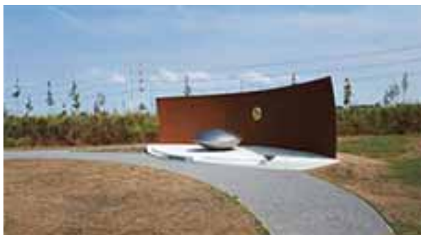
Monument in het herdengkingsbos / park MH 17

groot/breed zijn. Trek ook bij een bezoek dichte schoenen aan.