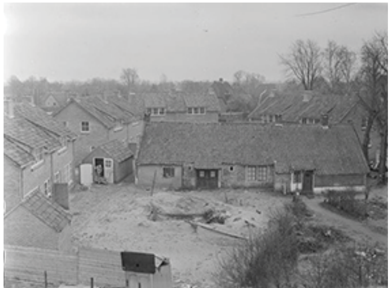
In het midden het legen Armenhuis en de woningen in aanbouw erom heen