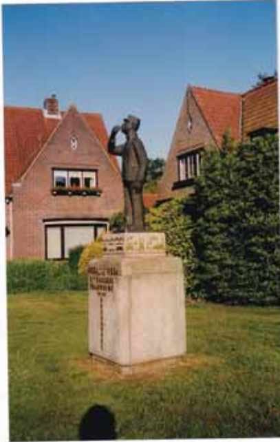
Het beeld "De Conducateur" in het grasveld tegenover de Rabobank