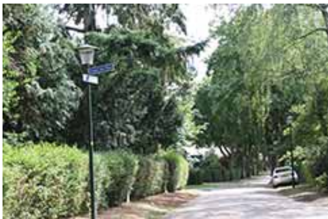
De foto is genomen vanaf de hoek 'Onder den Dael', richting Noolseweg.