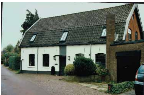
Krommepad 776. Dat is nu Oosterend 8A