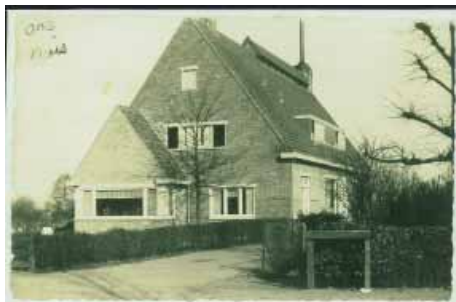
Wasserij aan het Klooster in Laren