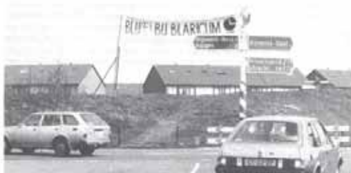
... Bijvanck ...